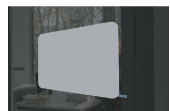
Rückseite mit Deckblatt